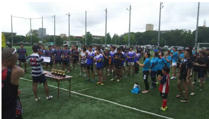
順位発表・表彰式