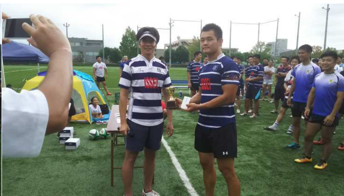
優勝 筑波大学OBチーム