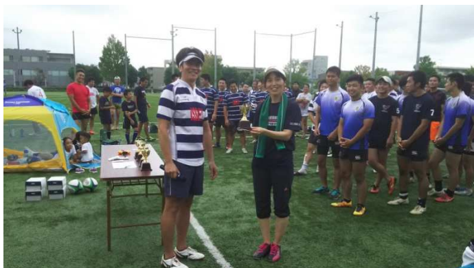
Woman of the day 松崎さん (つくばリアンズ Jr ママ)