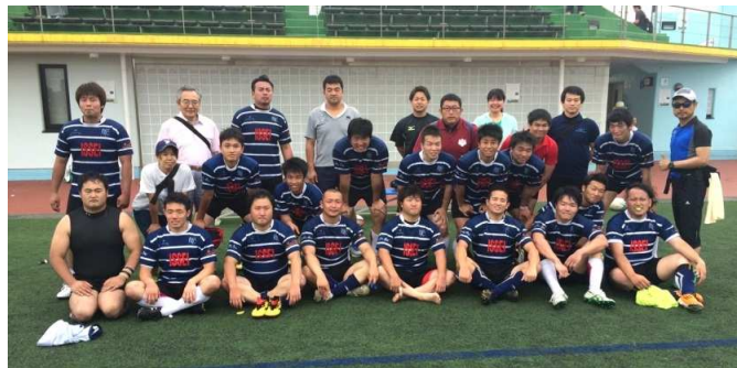
*ゲームキャプテンの背番号に○印