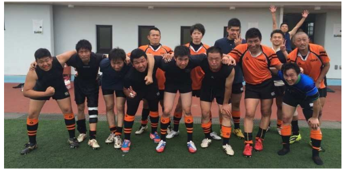
*ゲームキャプテンの背番号に○印